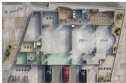
※図面と異なる場合は現現優先とします。